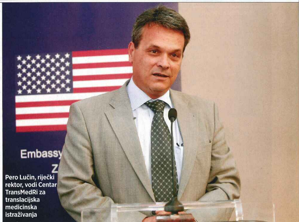
Pero Lučin, riječki rektor, vodi Centar TransMedRi za translacijska medicinska istraživanja

Osim što će u Rijeci pružiti najbolje obrazovanje i uvjete studiranja studentima i djelatnicima na način da regrutiraju i zadržavaju najbolje nastavnike, znanstvenike i studente, njima će osigurati i vrhunsku infrastrukturu i kolaborativne razmjene na svjetskoj razini s najboljim centrima visokog obrazovanja i znanosti.